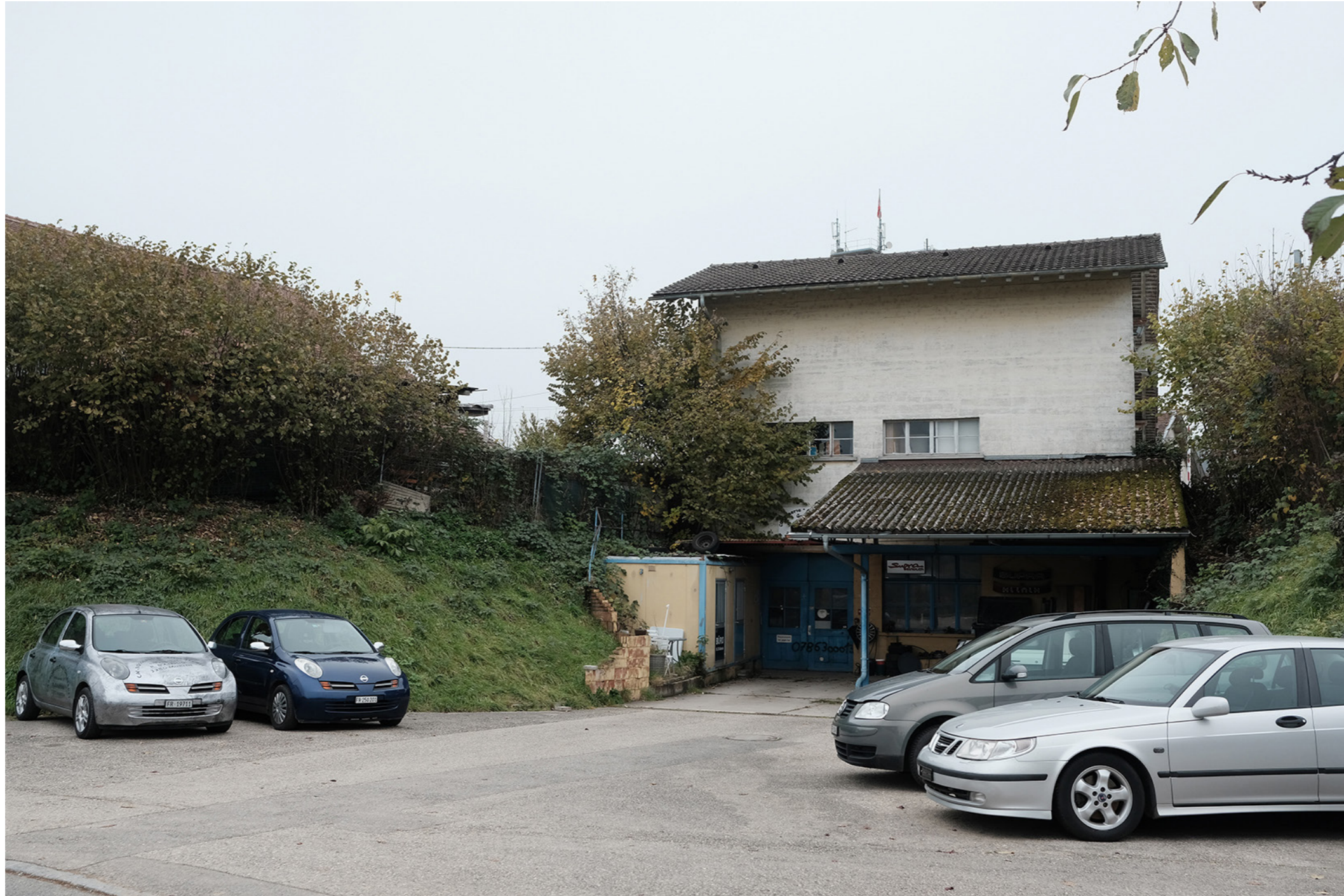
CHEMIN DE L'ÉGLISE