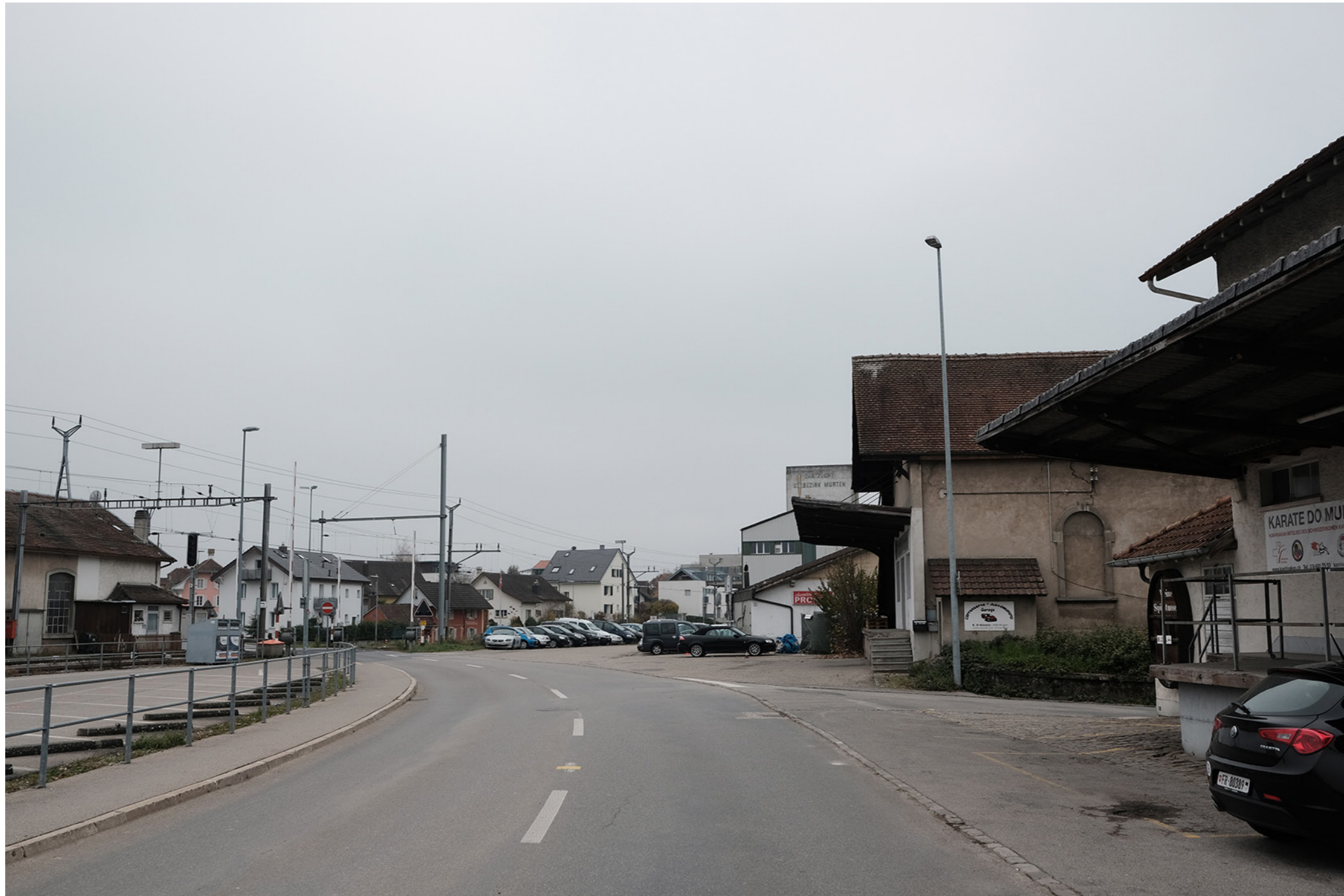
SICHT VON DER FREIBURGSTRASSE